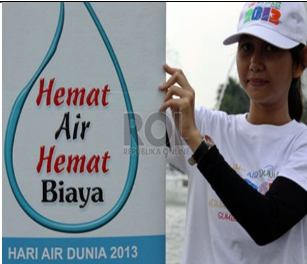
Celebrating World Water Day, MAPALA UI Started An Environmental Movement for Ciliwung