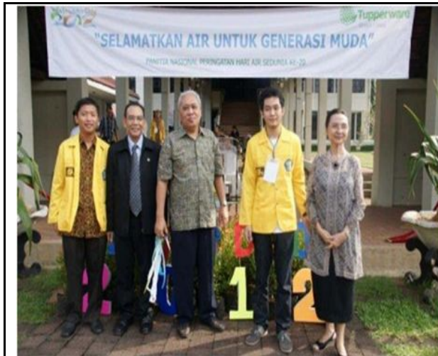
UI Organized A World Water Day Festival