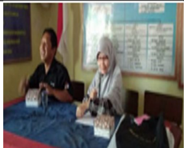
“Water Counting” Program to Solve Water Scarcity in Tianyar Village, Karang Asem, Bali