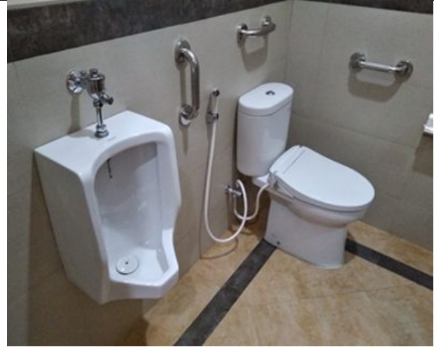
Utilization of Water-Saving Devices in UI