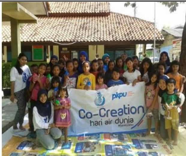
World Water Day Seminar, PKPU Collaborated with UI Students