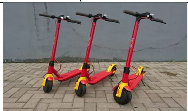
Gowes Electric Scooters