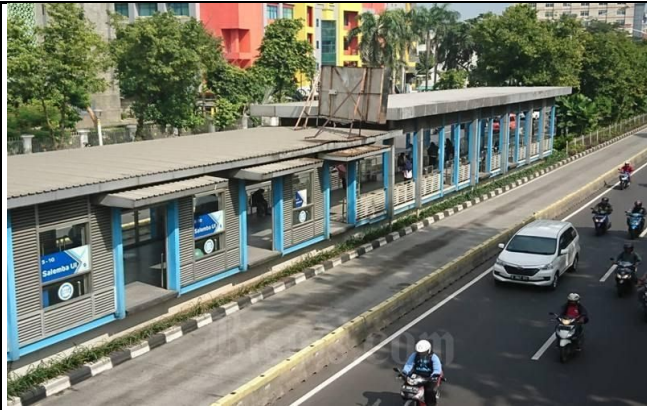
Transjakarta Bus Stop