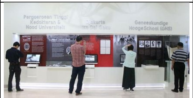
Health and Medicine Museum of IMERI FKUI