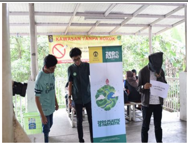
Universitas Indonesia Zero Plastic Program