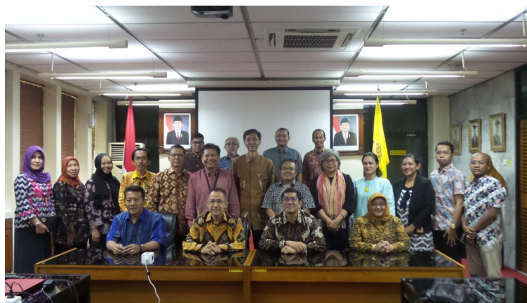
Signing of MoU between UI and the Ministry of Law and Human Rights