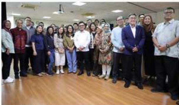
Kuliah Umum: Authentic Leadership