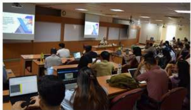
Kuliah Umum: Kebijakan Publik dan Dampaknya Terhadap Pengelolaan Keuangan Negara: Perspektif dari Dunia BUMN